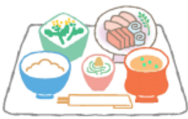
栄養バランスの良い食事

口内炎で最も一般的なアフタ口内炎は、確かな原因はわかりませんが、からだの免疫力が低下した時に、口の中の細菌によって引き起こされたり、胃腸などの内臓障害が主な原因と考えられています。予防法としては、栄養バランスの整った食事を心がける。睡眠をしっかりと、ストレスを溜めない。普段から正しいブラッシングを心がけ、お口の中を清潔に保つなどが大切です。